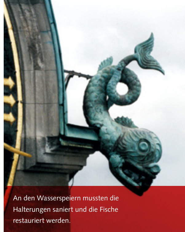
An den Wasserspeiern mussten die Halterungen saniert und die Fische restauriert werden.