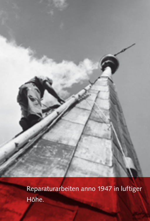
Reparaturarbeiten anno 1947 in luftiger Höhe.