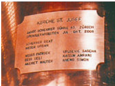
Ob als Urkunde in der Turmkugel oder als Schild: Die Spengler stehen zu ihrer Arbeit

Kirchen oder kulturhistorisch bedeutenden Bauten ist eher selten. Man schaut sich dann ganz genau den Zustand an, was erhalten werden kann oder tatsächlich nachgebaut werden muss. Bei den meisten Projekten geht es gleichzeitig um eine zeitgemässe Nutzung, um Ausbau und Erweiterung, um zusätzliche Wärmedämmung und eine bessere Energiebilanz sowie um die nachhaltige Sicherung der Bausubstanz. Sanierungen sind aufwendig, da möchte die Bauherrschaft etwas von Dauer. Dabei ermöglicht das Bauen mit Metall eine grösstmögliche Flexibilität. Wir können Dächer und Fassaden in allen erdenklichen Formen realisieren – freizügig und detailgenau. Das macht uns nicht nur für Renovationen interessant, sondern auch die moderne Architektur.