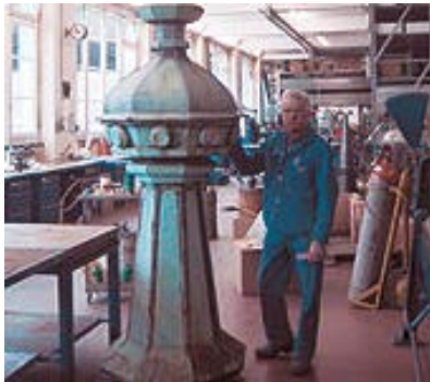
Während die Arbeiten am Dach fortschreiten, werden Turmspitze, Kugel und Kreuz in der Werkstatt renoviert