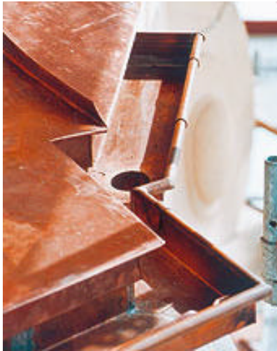
Handwerklich massgeschneidert: Die Grundform des Daches wird auch von der präzise angepassten Regenrinne aufgenommen.